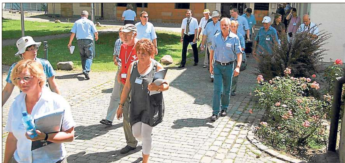
Brütend heiß war es vor drei Jahren, als die Kreiskommission nach Oestinghausen kam. Willkommenen Schatten spendeten die Bäume auf dem Kirchplatz.

liche Entwicklung und Initiativen“, „Soziales und kulturelles Leben“, „Baugestaltung und -entwicklung“, „Grüngestaltung und -entwicklung“ und „Dorf in der Landschaft“. Die Jury-Mitglieder haben die einzelnen Bewertungsbereiche unter sich aufgeteilt, gibt der Kreis Soest in einer Pressemitteilung bekannt. Die Bekanntgabe der Sieger und die Preisverleihung finden am Freitag, 27. Juni, ab 17 Uhr in der Schützenhalle Mellrich-Waltringhausen (Schützenstraße 17, Anröchte) statt. Es winken Preisgelder in einer Gesamthöhe von 30 000 Euro, die durch zusätzliche Sonderpreise für besondere und beispielhafte bürgerschaftliche Leistungen in unterschiedlichen Kategorien aufgestockt werden. Als Sponsoren treten die Volksbank Hellweg Immobilien, die Sparkassen Soest und Lippstadt, die Bürgerstiftung Hellweg, die Stadtwerke Soest und Lippstadt, die Gemeindeförderung Bad Sassendorf und die Wirtschaftsförderung Kreis Soest in Erscheinung.